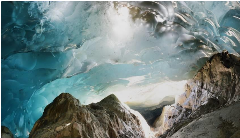
Diewke van den Heuvel, Cave 2020 uit de serie Melting Heart.

Tentoonstelling in het Van Abbe Museum te Eindhoven t/m 24 november 2024